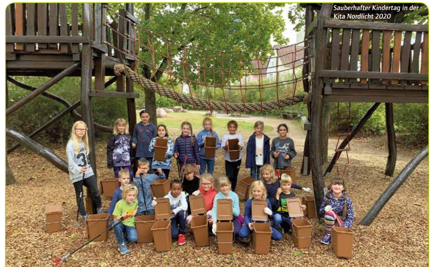
Sauberhafter Kindertag in der Kita Nordlicht 2020

Kommunale Betriebe Langen Wertstoffhof, Darmstädter Straße 70 www.kb-langen.de